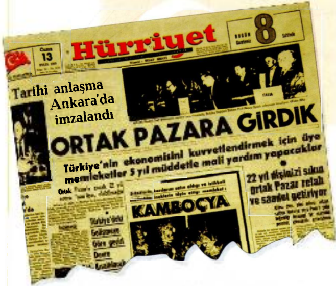
(Hürriyet Gazetesi'nin 13 Eylül 1963 tarihli nüshasından...)

3- Yunanistan ile AET arasında ortaklık Antlaşması 1 Kasım 1962'de yürürlüğe girdi. Türkiye'de 1961 sonunda seçimler yapıldı. Sivil iktidar işbaşına geçti. Talat Aydemir ve arkadaşları 22 şubat 1962 ve 21 Mayıs 1963 tarihlerinde iki defa ihtilale teşebbüs etti. Türkiye bir kaos, darbeler ve koalisyonlar dönemi içindeydi.