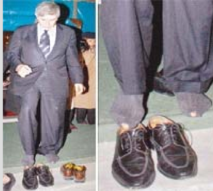
PAUL WOLFOWITZ @ SELİMİYE CAMİİ - EDİRNE